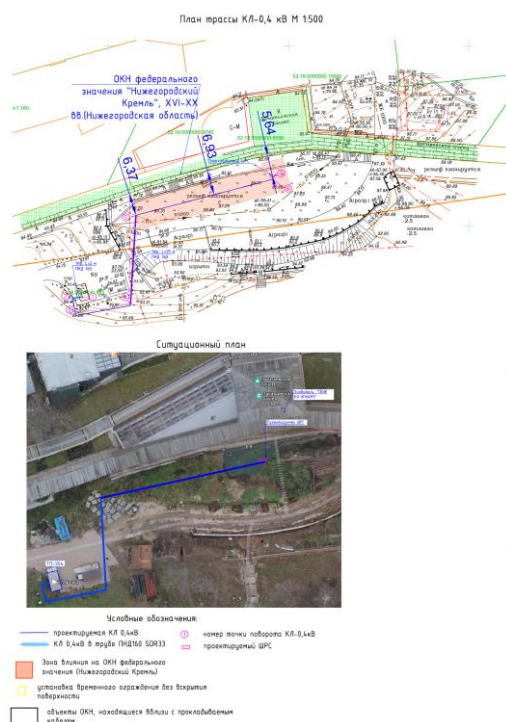
Рис. 1. План трассы КЛ-0,4 кВ, ситуационный план шифр 68/24-1988-08-ЭС.

Участок проектируемой инженерной коммуникации располагается в историческом центре г. Нижнего Новгорода, на территории Нижегородского Кремля.